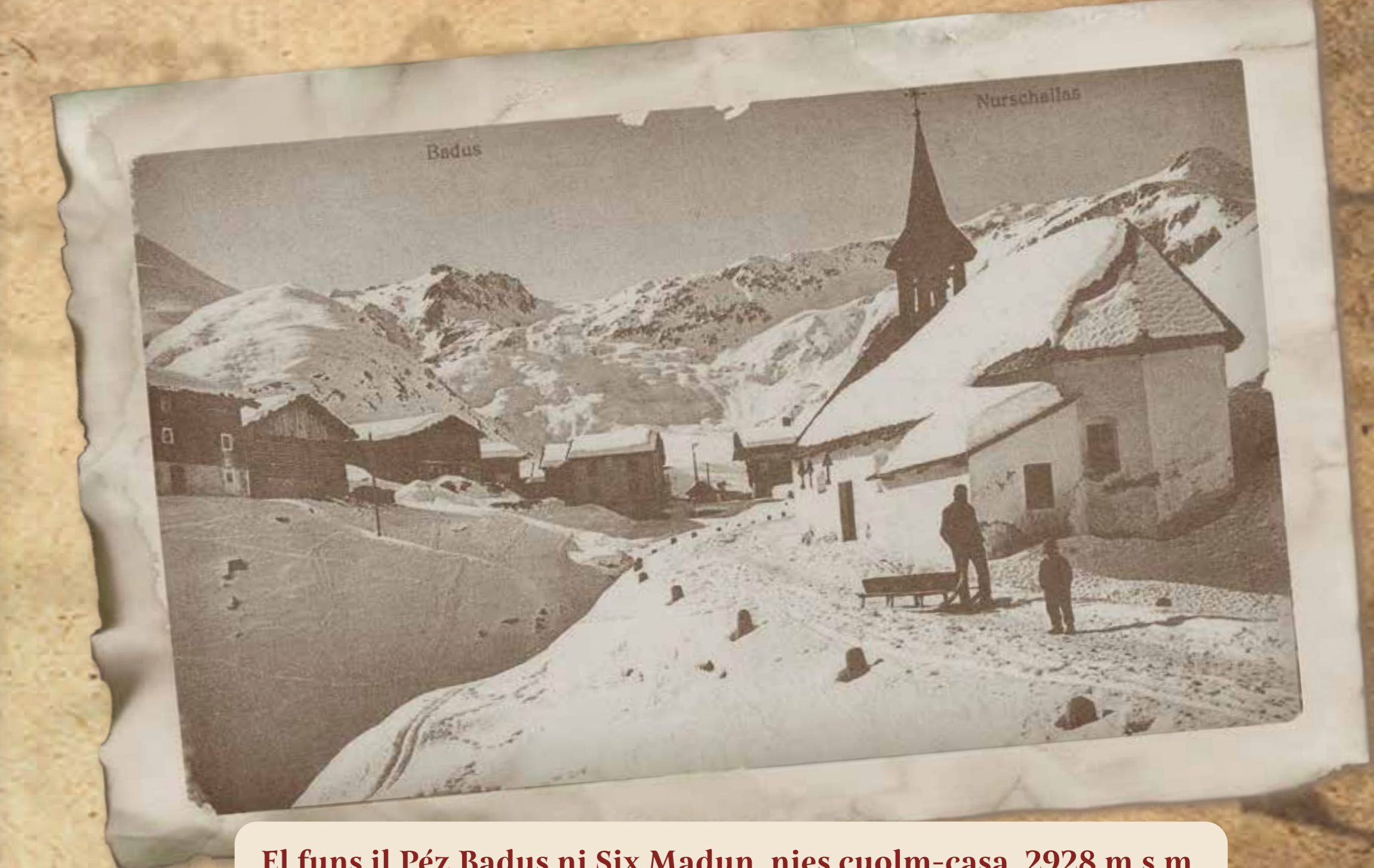
El funs il Péz Badus ni Six Madun, nies cuolm-casa, 2928 m.s.m. Emprena ascensiuin 1785 entras pader P. a Spescha. Im Hintergrund liegt der Piz Badus oder Six Madun, unser Hausberg, 2928 m. ü. M. Erstbesteigung 1785 durch Pater Placidus a Spescha.

In Tschamut in Prauina, diesseits der Brücke, ist eine alte Mauer. Unterhalb derselben kam abends in der Dämmerung immer ein Priester talaus gegangen, ein grosser Mann, mit einem Buch in der Hand. Der ging am Rhein auf und ab, und dann verschwand er wieder. Wir Mädchen hatten Angst vor ihm. Wenn ich dort mähen gehen musste, bin ich heimgegangen, bevor es dunkel wurde. Dieser Priester musste, wahrscheinlich, zur Busse dort sein Brevier lesen, das er einmal versäumt hatte.